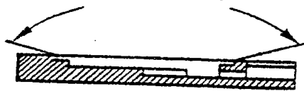
شکل ۲- بسته تک سلولی